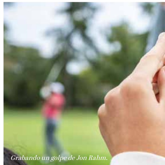
Grabando un golpe de Jon Rahm.