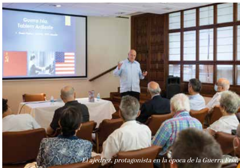
El ajedrez, protagonista en la época de la Guerra Fría.