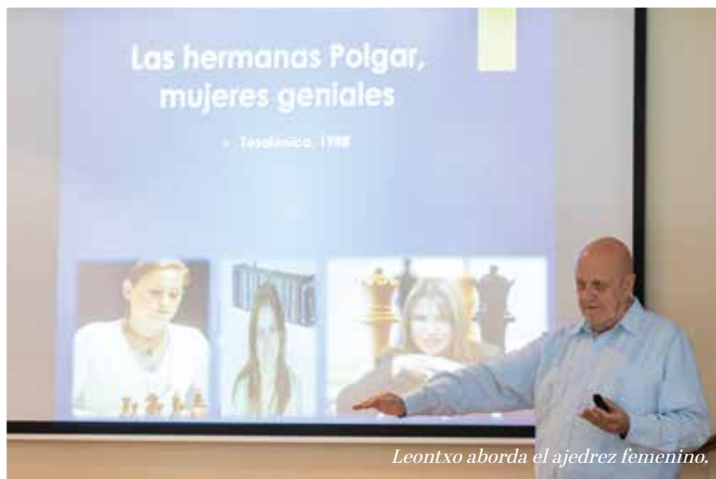
Leontxo aborda el ajedrez femenino.

Leontxo García, periodista de El País y posiblemente el mayor divulgador del juego del ajedrez de los últimos tiempos, impartió en junio una interesantísima conferencia en el Chalet Social. Su paso por el Club coincidió en el tiempo con la celebración del Torneo de Candidatos de Ajedrez, disputado en el Palacio de Santoña en Madrid en esas fechas, y en el que se determinó el futuro aspirante a destronar al actual campeón del mundo Magnus Carlsen. Como iniciativa complementaria, el Club sorteó 16 entradas para asistir a dicho Torneo de Candidatos entre los miembros de nuestra Sección de Ajedrez.