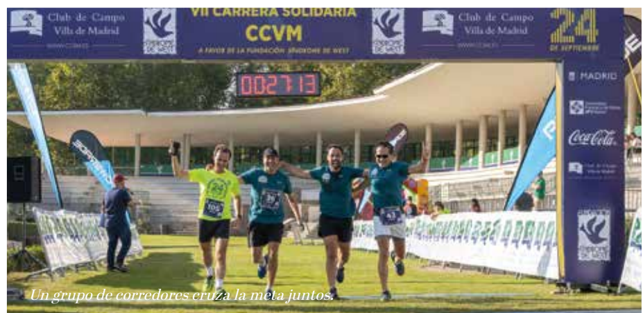
Un grupo de corredores cruza la meta juntos.