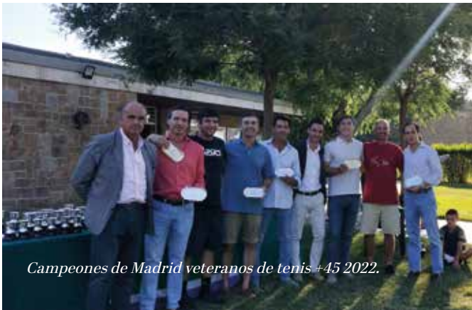
Campeones de Madrid veteranos de tenis +45 2022.