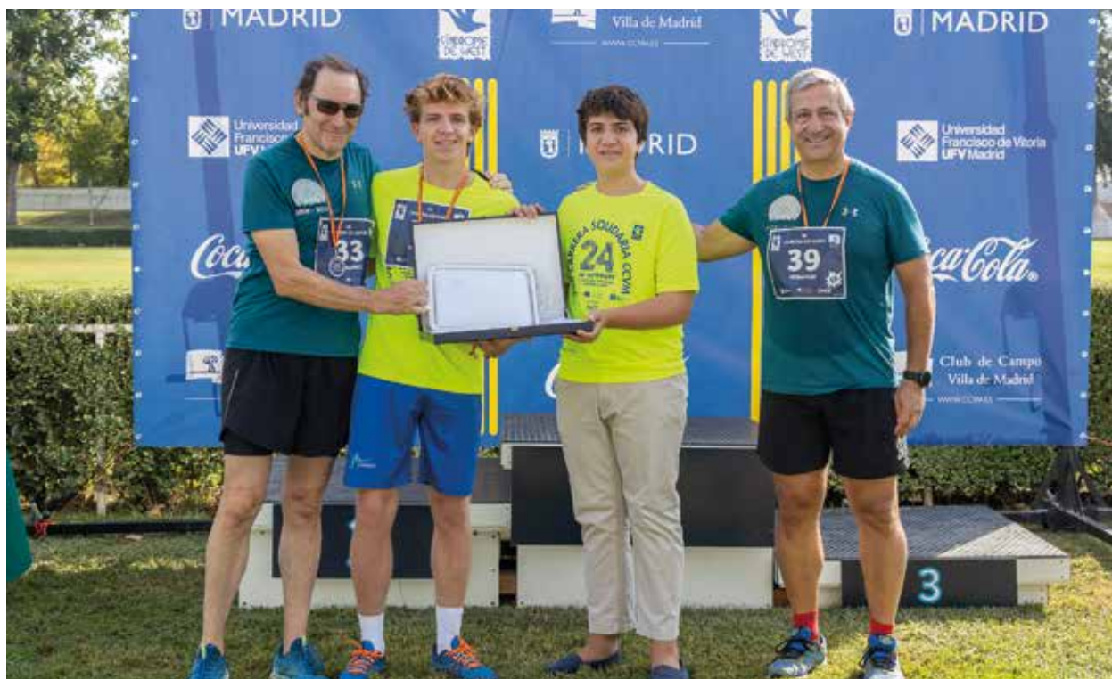
Los hijos de Íñigo Lapetra reciben una placa como homenaje.