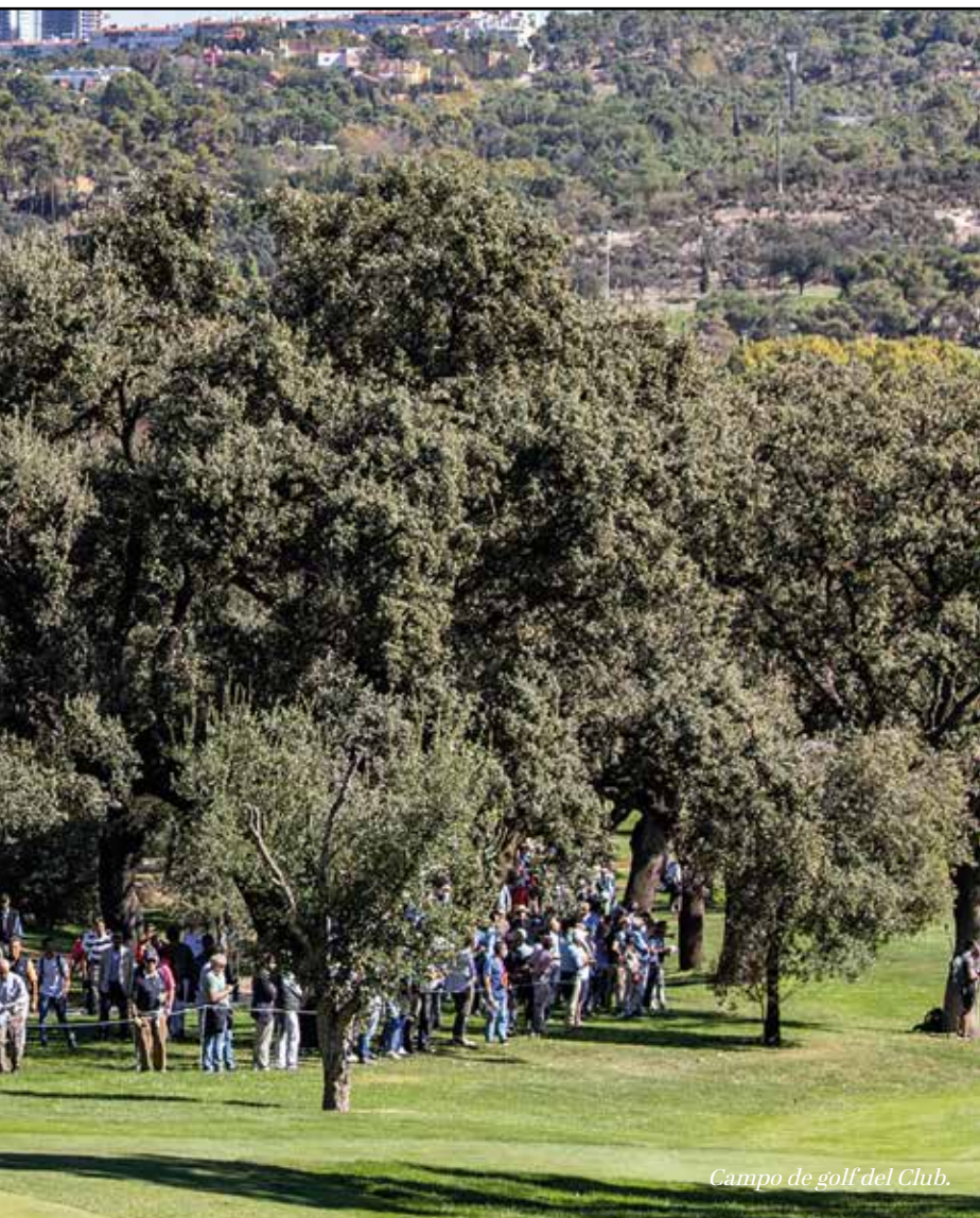
Campo de golf del Club.