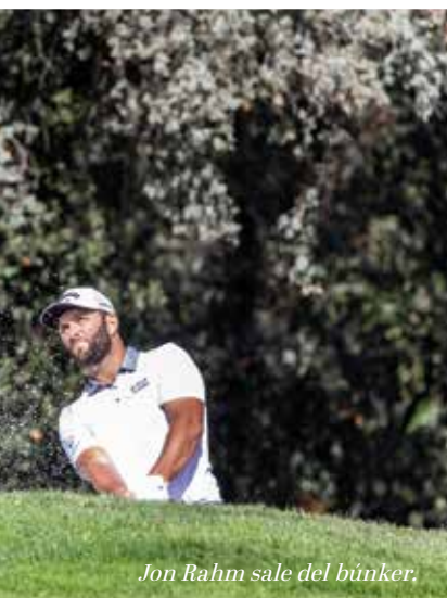
Jon Rahm sale del búnker.