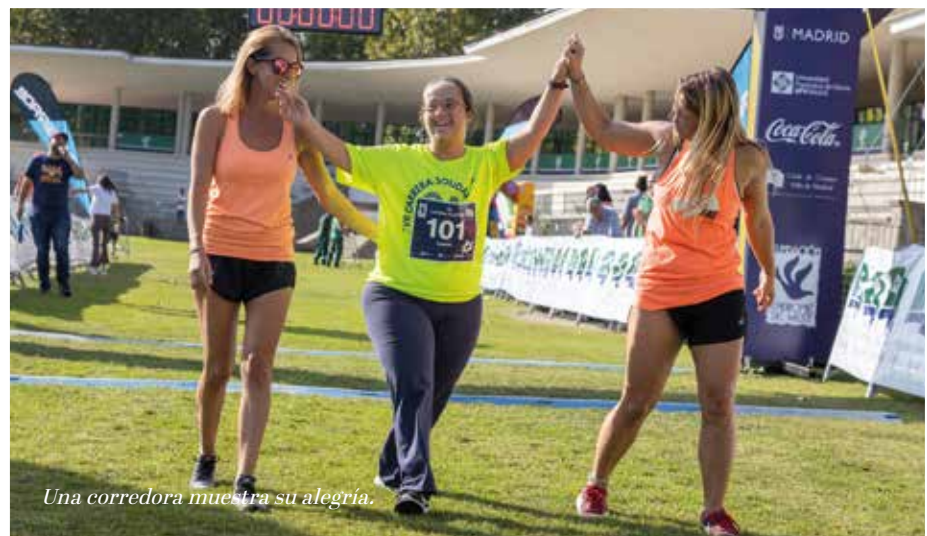
Una corredora muestra su alegría.