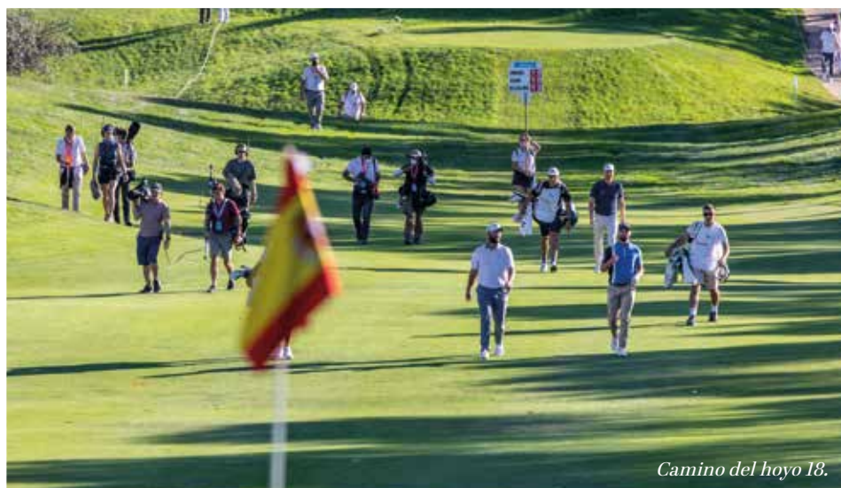
Camino del hoyo 18.