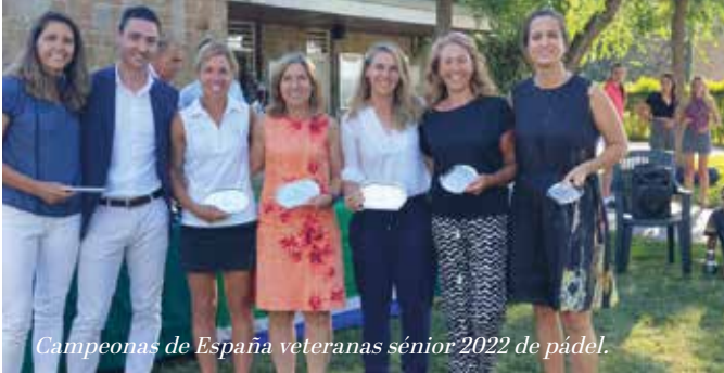
Campeonas de España veteranas sénior 2022 de pádel.