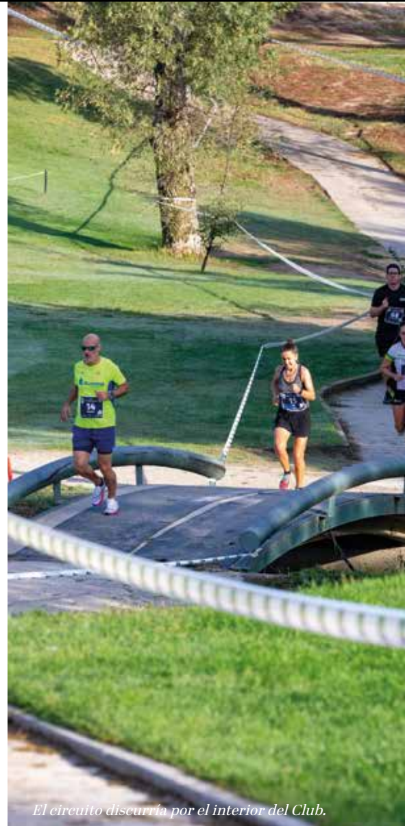
El circuito discurría por el interior del Club.