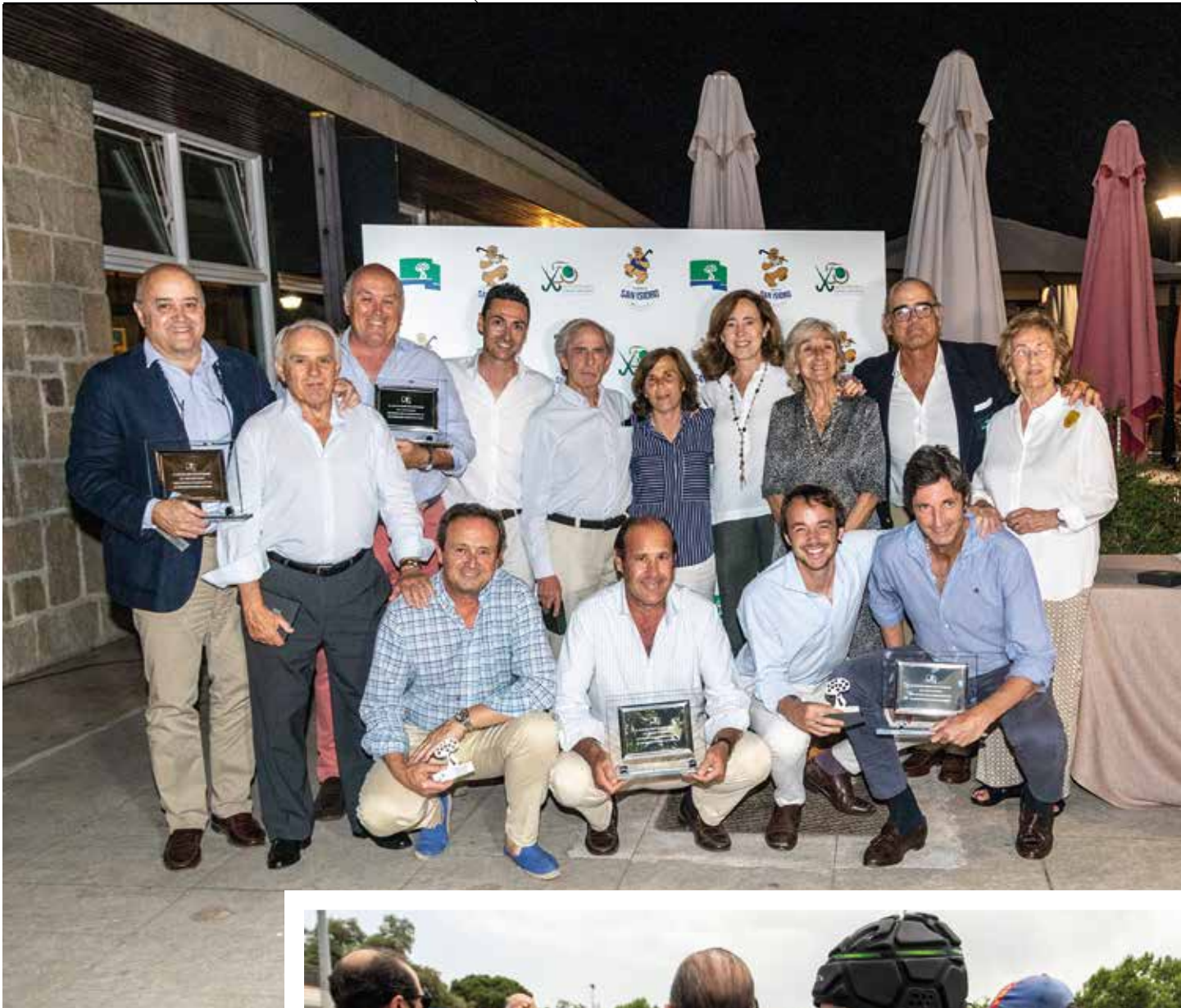
Reconocimiento a personalidades por su labor en el Torneo de San Isidro.