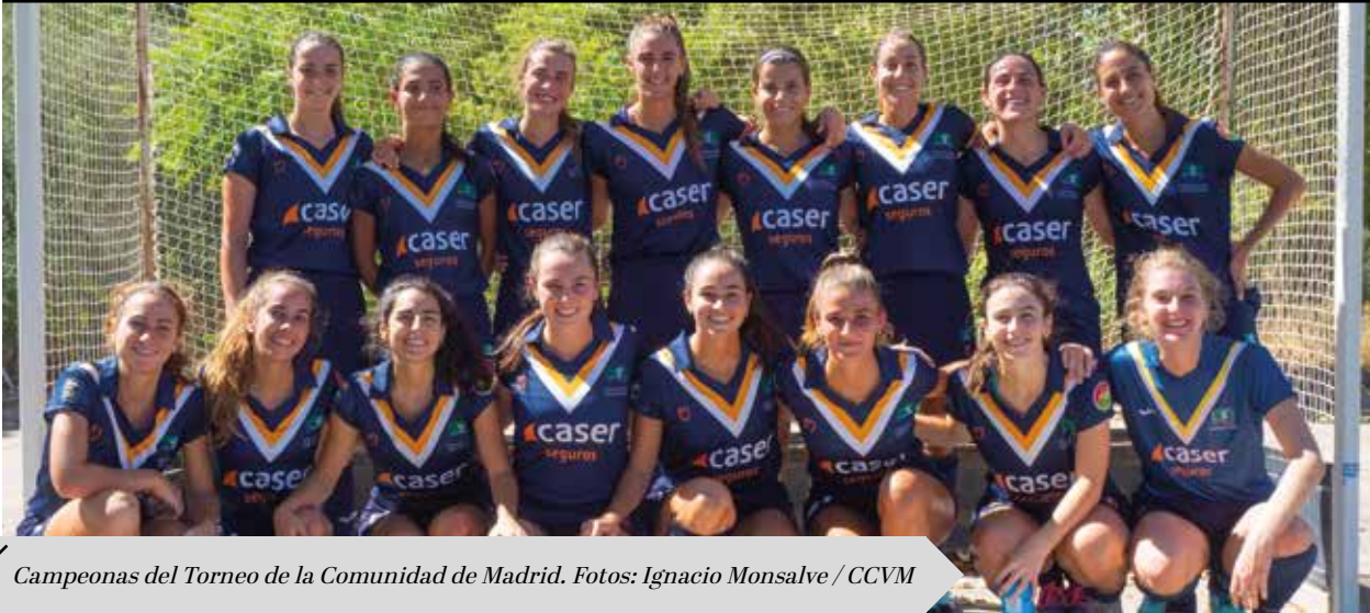
Campeonas del Torneo de la Comunidad de Madrid.