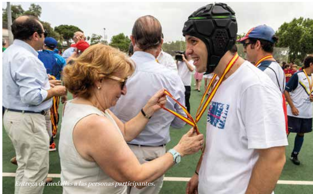
Entrega de medallas a las personas participantes.