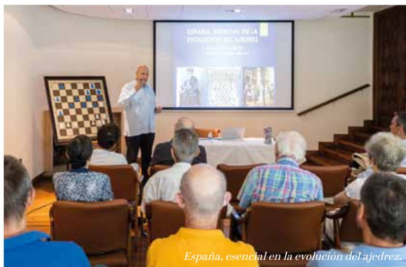
España, esencial en la evolución del ajedrez.