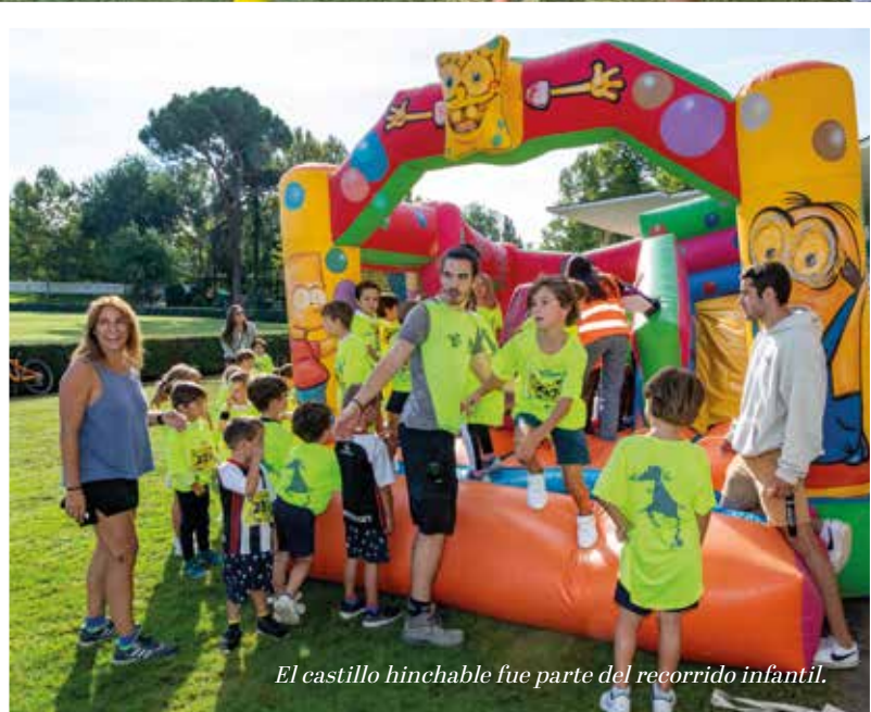
El castillo hinchable fue parte del recorrido infantil.