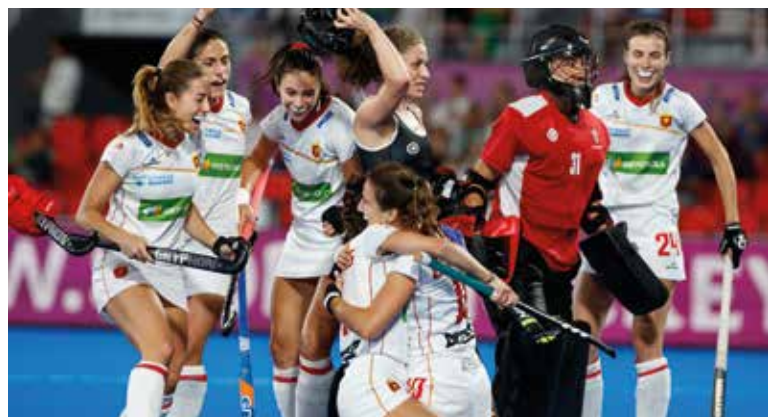
Las jugadoras españolas celebran el triunfo ante Canadá.