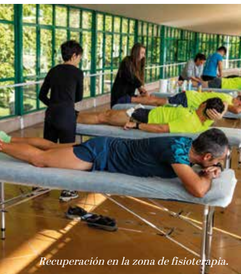
Recuperación en la zona de fisioterapia.