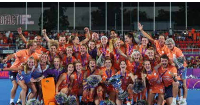
Las jugadoras de Países Bajos celebran la conquista del Mundial.