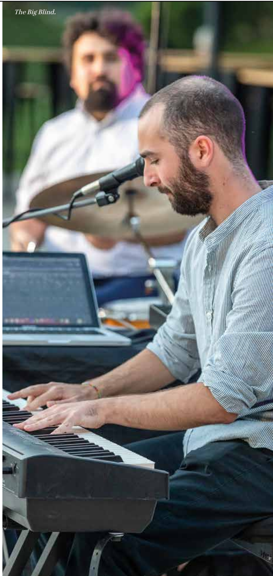
The Big Blind.