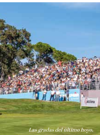
Las gradas del último hoyo.