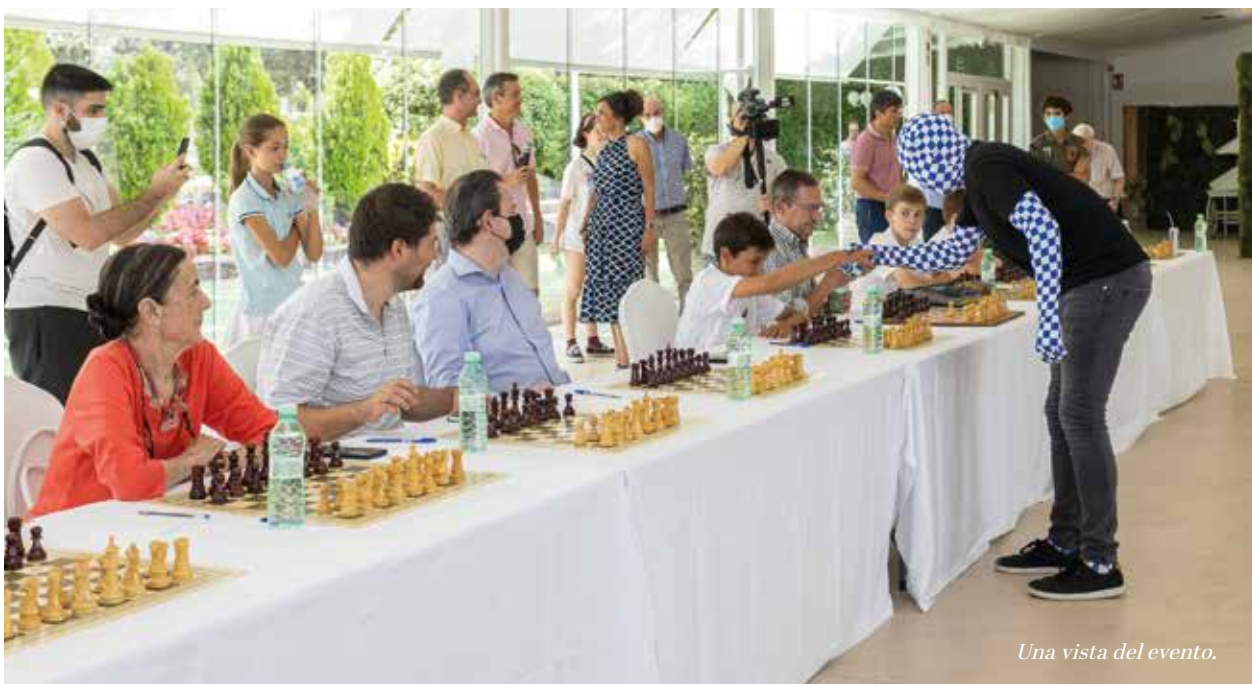
Una vista del evento.