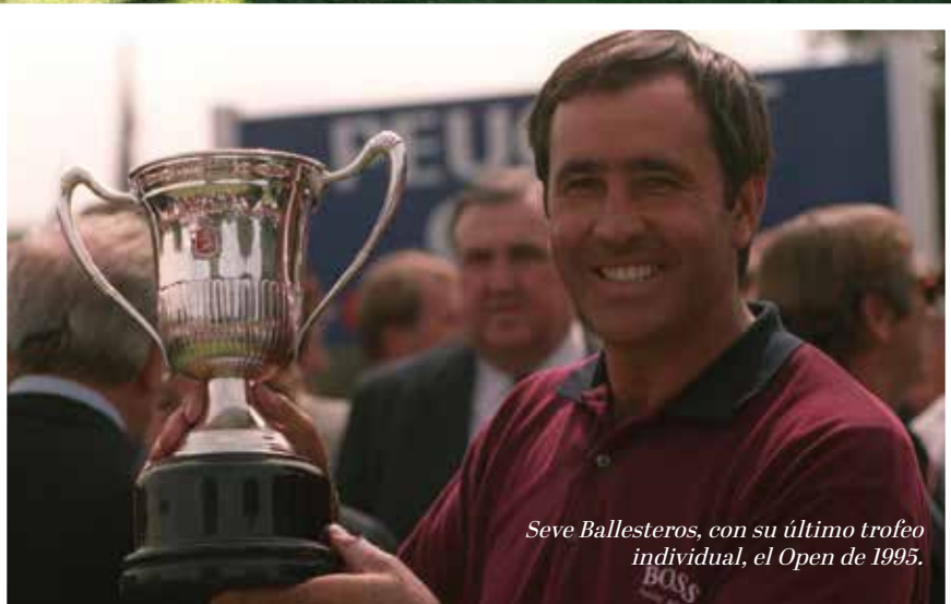
Seve Ballesteros, con su último trofeo individual, el Open de 1995.

El Open tardó más de 20 años en volver al Club y, en 1982, el escocés Sam Torrance alzó el trofeo de campeón. Luego llegaron los triunfos del australiano Rodger Davis (1990), el argentino Eduardo Romero (1991), el escocés Colin Montgomerie (1994), Severia-