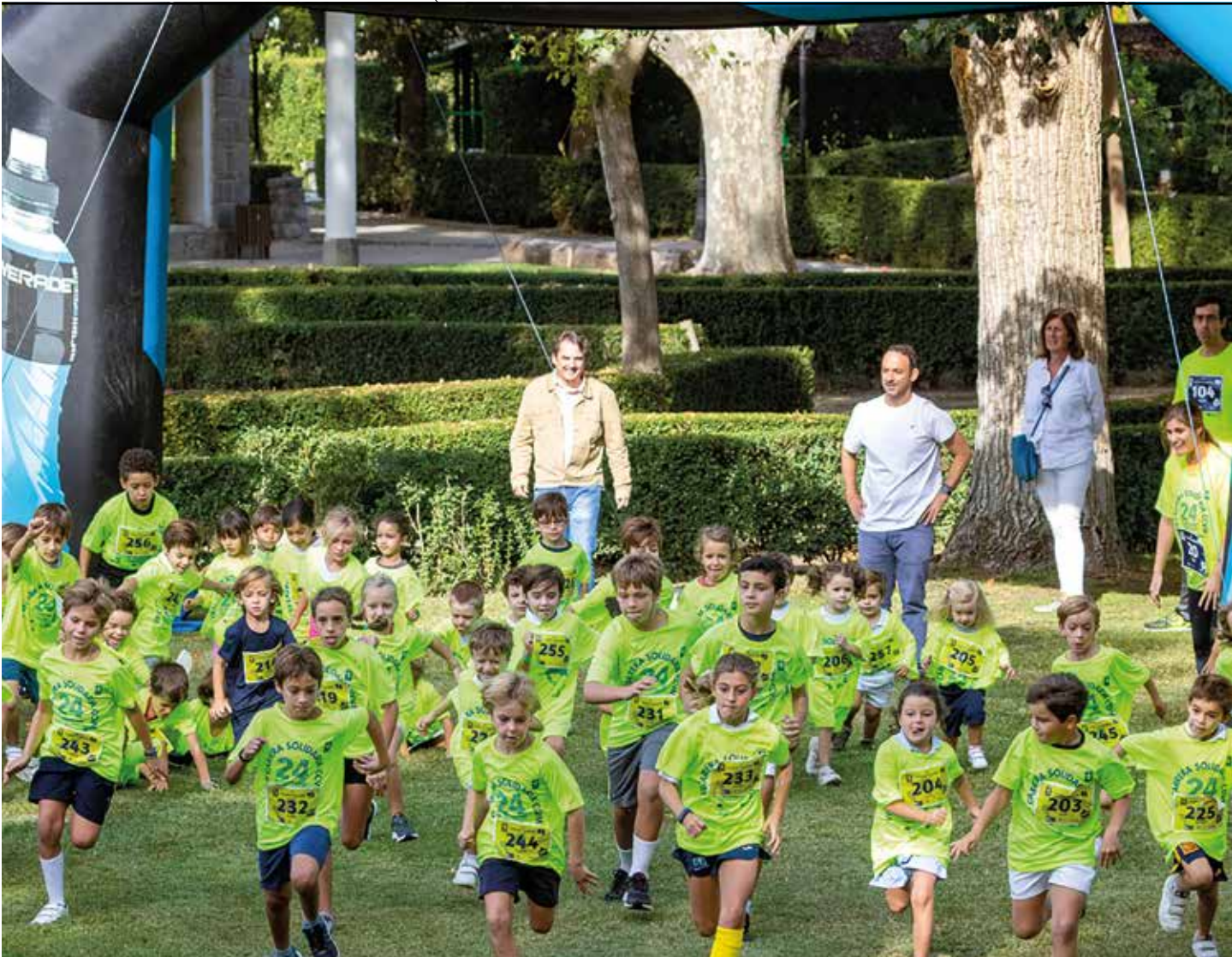
Los niños disfrutaron de la competición infantil.