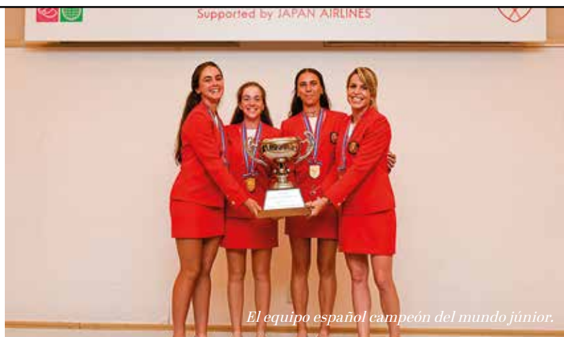
El equipo español campeón del mundo junior.