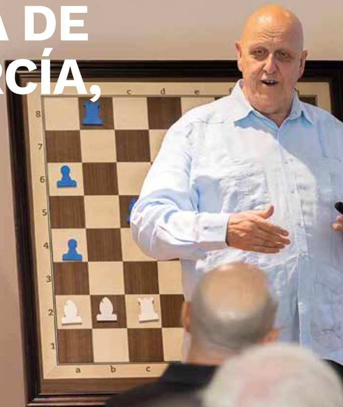
Un momento de la conferencia.