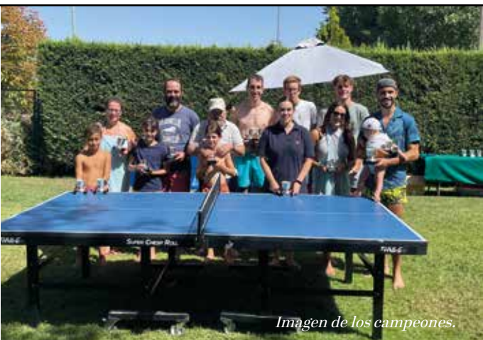
Imagen de los campeones.