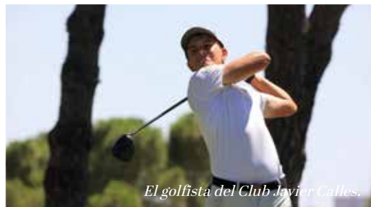
El golfista del Club Javier Calles.