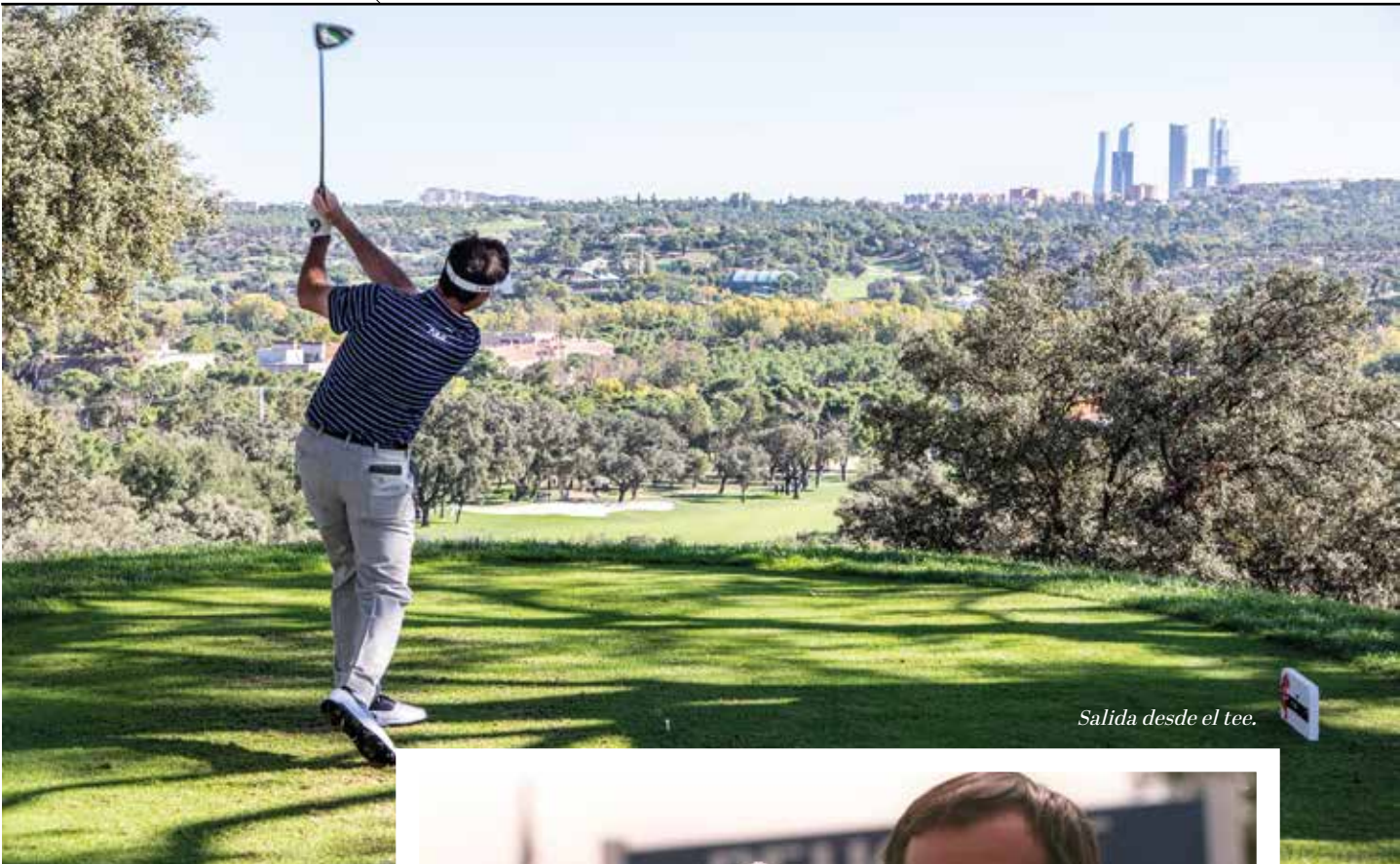
Salida desde el tee.