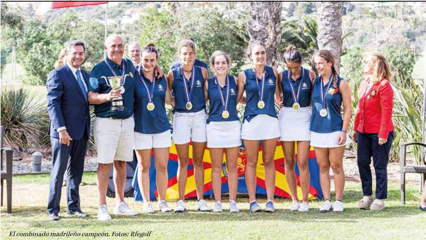
El combinado madrileño campeón.