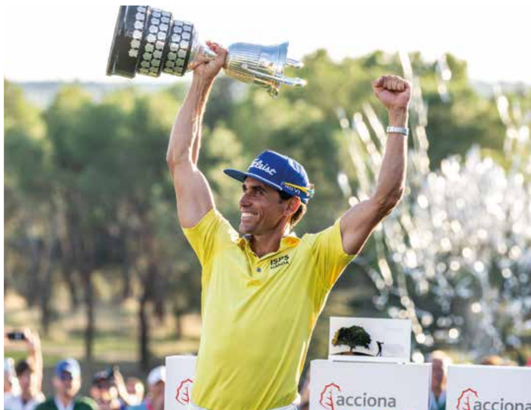
Rafa Cabrera-Bello levanta la copa de 2021

En cuanto a las estrellas internacionales que competirán en el Club, está confirmada la presencia del inglés Tommy Fleetwood, quien ha logrado cinco títulos en el DP World Tour y la Ryder Cup de 2018.