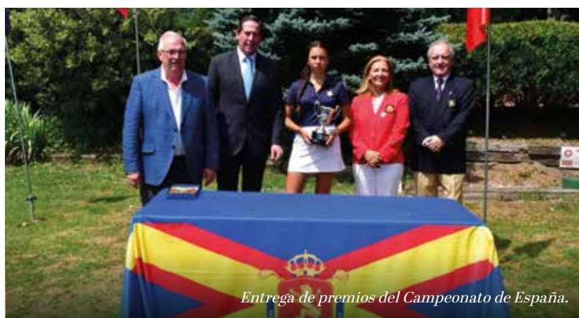
Entrega de premios del Campeonato de España.