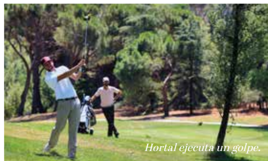
Hortal ejecuta un golpe.