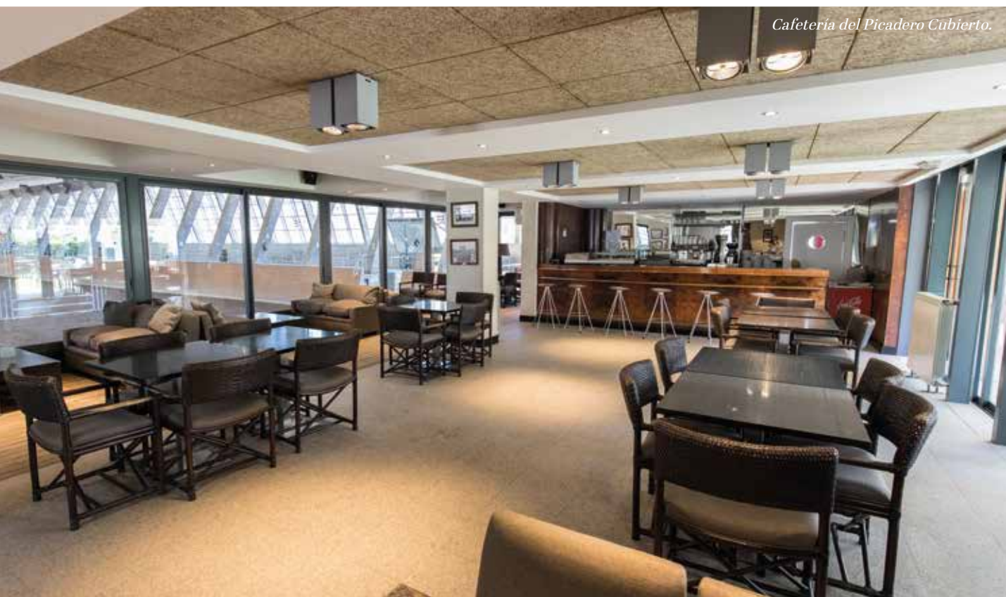
Cafetería del Picadero Cubierto.

Durante la celebración del torneo, los restaurantes del Picadero Cubierto y del Chalet de Tenis estarán abiertos con total normalidad, reforzando el Club el servicio de hostelería y restauración en estos espacios para ofrecer la mejor atención a los Sres. Abonados. Les recordamos que el Chalet Social permanecerá cerrado del 3 al 10 de octubre.