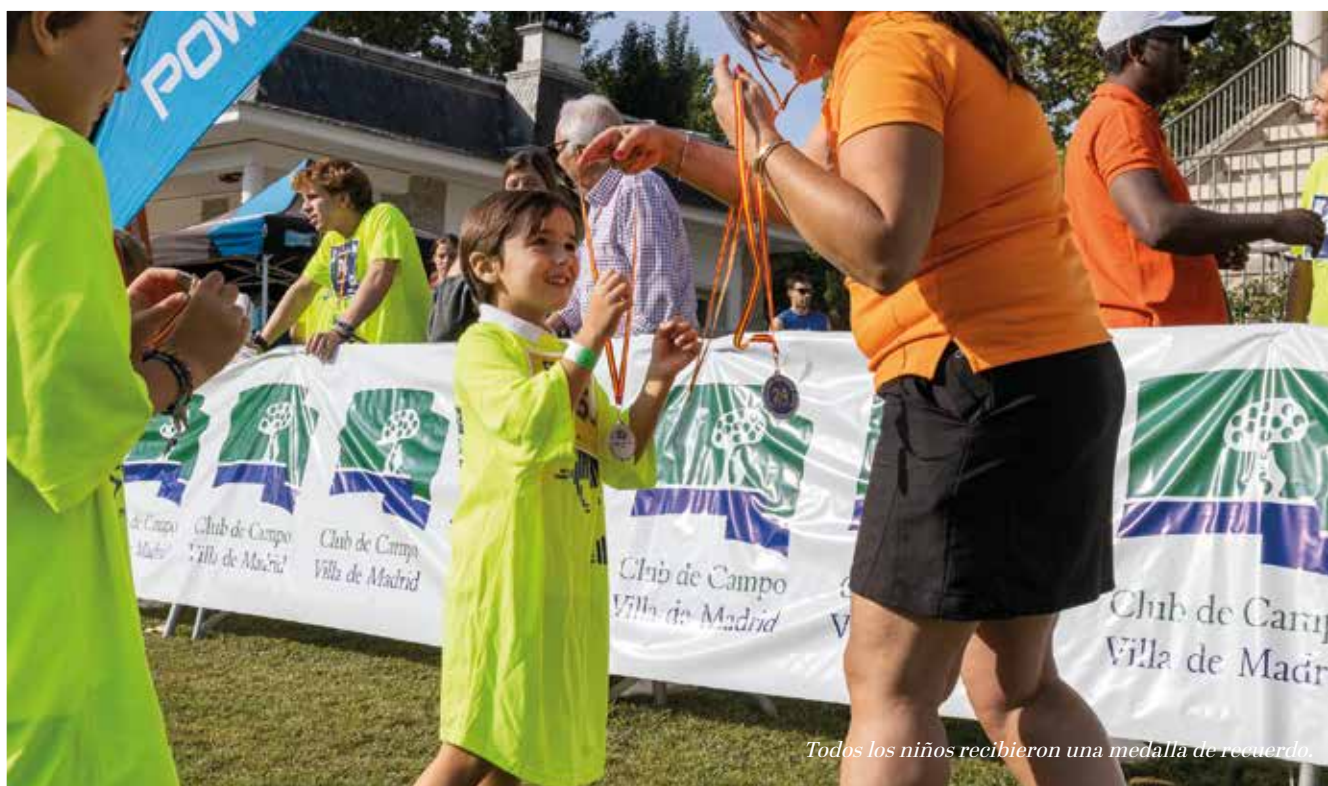
Todos los niños recibieron una medalla de recuerdo.