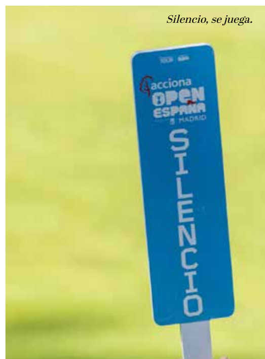
Silencio, se juega.