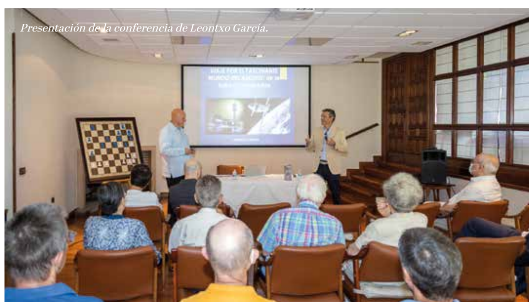
Presentación de la conferencia de Leontxo García.