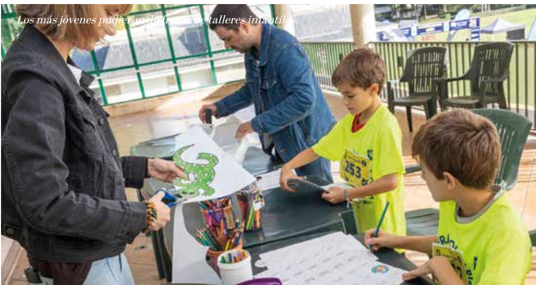
Los más jóvenes pudieron disfrutar de talleres infantiles.