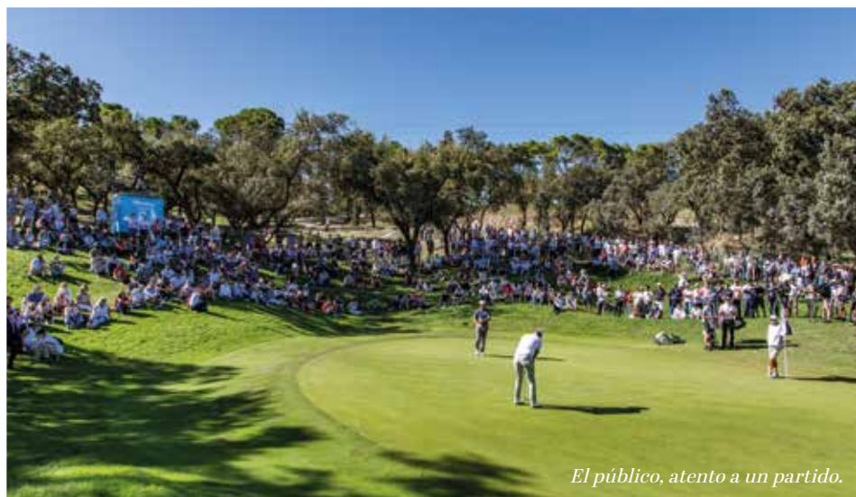
El público, atento a un partido.