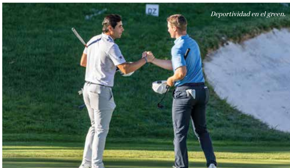
Deportividad en el green.